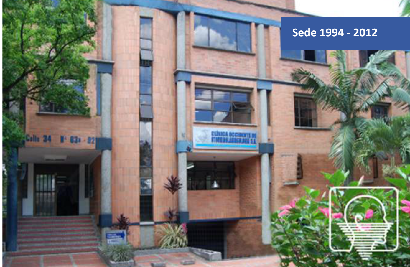
Sede 1994 - 2012

Esto permitió visualizar una primera etapa de crecimiento, que se inició el 25 de mayo del 2011: sede que ahora usamos, en la cual no construimos un quirófano más, sino que integramos todos los servicios en un solo lugar, permitiendo una nueva imagen a nuestra institución y el ingreso de 3 nuevos socios. Obra que se dio al servicio en su totalidad el martes 13 de noviembre del 2012 y que actualmente disfrutamos.