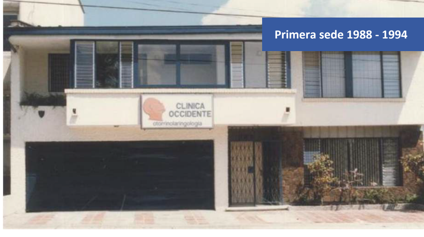
Primera sede 1988 - 1994

Se inició el proyecto y en esa se incluyó por primera vez la idea de tener una segunda recuperación, algo novedoso para su época, además de tener Radiología, laboratorio de alergias, 3 quirófanos y 8 consultorios, para dar cabida a los 9 socios nuevos que habían ingresado. La cual se inauguró luego de cinco años y medio de la primera sede, en las fechas de mayo de 1994.